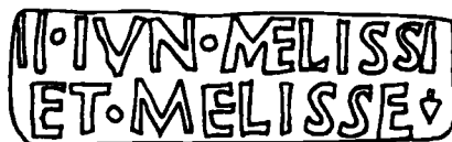
2. Bollo di Dressel 20 con la scritta II IVN MELISSI ET MELISSE, rinvenuto a Las Delicias (da PONSICH 1991, fig. 23, 5).

C'è unanime consenso nel considerare i nomi in genitivo dei tituli beta come individui coinvolti nella commercializzazione e distribuzione dell'olio, ma è più difficile individuarne l'esatta funzione, dato che iscrizioni extra-anforiche riferibili ad alcuni di questi personaggi riportano varie professioni: mercatores (commercianti), negotiatores (commercianti all'ingrosso?), diffusores (distributori-versatori?)