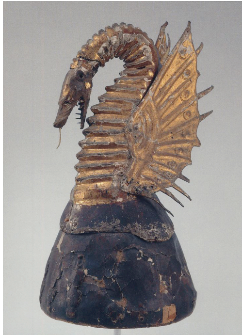
Fig. 4: Cimera del drac alat de Martí l'Humà, ca. 1407, Reial Armeria de Madrid.

en el moment en què deixaren de tenir una utilitat pràctica per a esdevenir peces expositives a la Festa de l'Estendard, es classificaren com a objectes del Conqueridor. Si bé no és una tasca fàcil acoblar una cronologia més o menys estreta a la sella i als estreps, el petó de junyir –una armadura protectora del pit típica dels cavallers de les justes– ha sigut datat pels especialistes a la segona meitat del segle XV (Alomar 1994: 73-74) i d'ençà que degué usar-se.