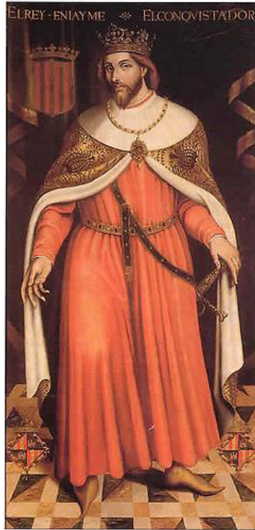
Fig. 2: Retrat del rei Jaume I, Andreu Reus, ca. 1623, Ajuntament de Palma.

Malgrat introduir-se a les acaballes del segle XV (Weyler 1968: 48), tot sembla indicar que a mitjan segle XVI s'estableix la Qualcada –una companyia de genets cavallers sovint capitanejats pel batlle o el veguer, que marxava abans de i durant el recorregut de la desfilada– amb unes intencions socials i polítiques a la Festa de l'Estendard. Sense extraure llur significat d'exhibició eqüestre, de desfilada triomfal que refermava el grau d'espectacle, la seua omnipresència –se li atorgà tanta importància que va canviar el nom de la Festa fins ben entrat el segle XIX– es deu a què representava la defensa militar de la ciutat. Una ciutat posterior a la sufocació dels agermanats, que seguia tement les possibles revoltes dels esclaus, així com dels moriscos (Quintana 1998: 137-138). I és que al llarg del segle XVI es produïren continus desembarcaments de sarraïns a les costes mallorquines, és per això que no debades es creà l'any 1551 un pla de defensa de l'illa; ni tampoc pareix casual la implantació del Tribunal de la Rota el 1571 a la ciutat de Mallorca, per ordre de Felip II. La Qualcada , doncs, coadjuvava a l'aristocratització de la Festa, tot suposant una visualització del resguard respecte de les amenaces internes i externes de la ciutat.