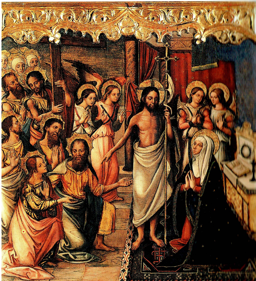
Vicent Macip, Visita a la mare de Déu, del retaule de sant Dionís i santa Margalida (principis s. XVI). València, Museu Diocesà.