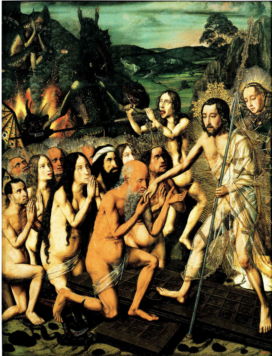
Bartolomé Bermejo, Davallament de Crist als llimbs (1475). Barcelona, MNAC.