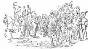
El Convit o Cavalcada