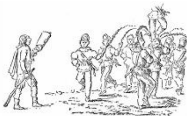
El Batlle i els Dansaires