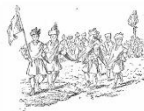
La Dansa de la Baieta