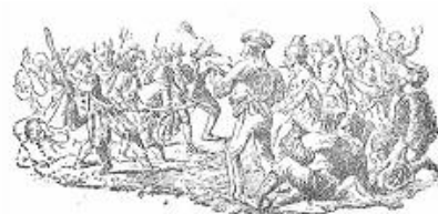
La baralla final amb els Contrabandistes

Il·lustració 1: algunes imatges dels episodis i comparses del Ball de Torrent segons (VALERO MONTERO 1893).