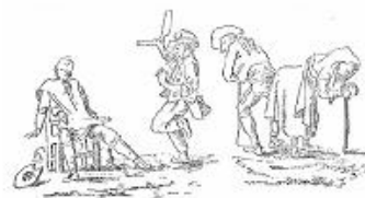
El Ball del Barber i El Ball dels Vells