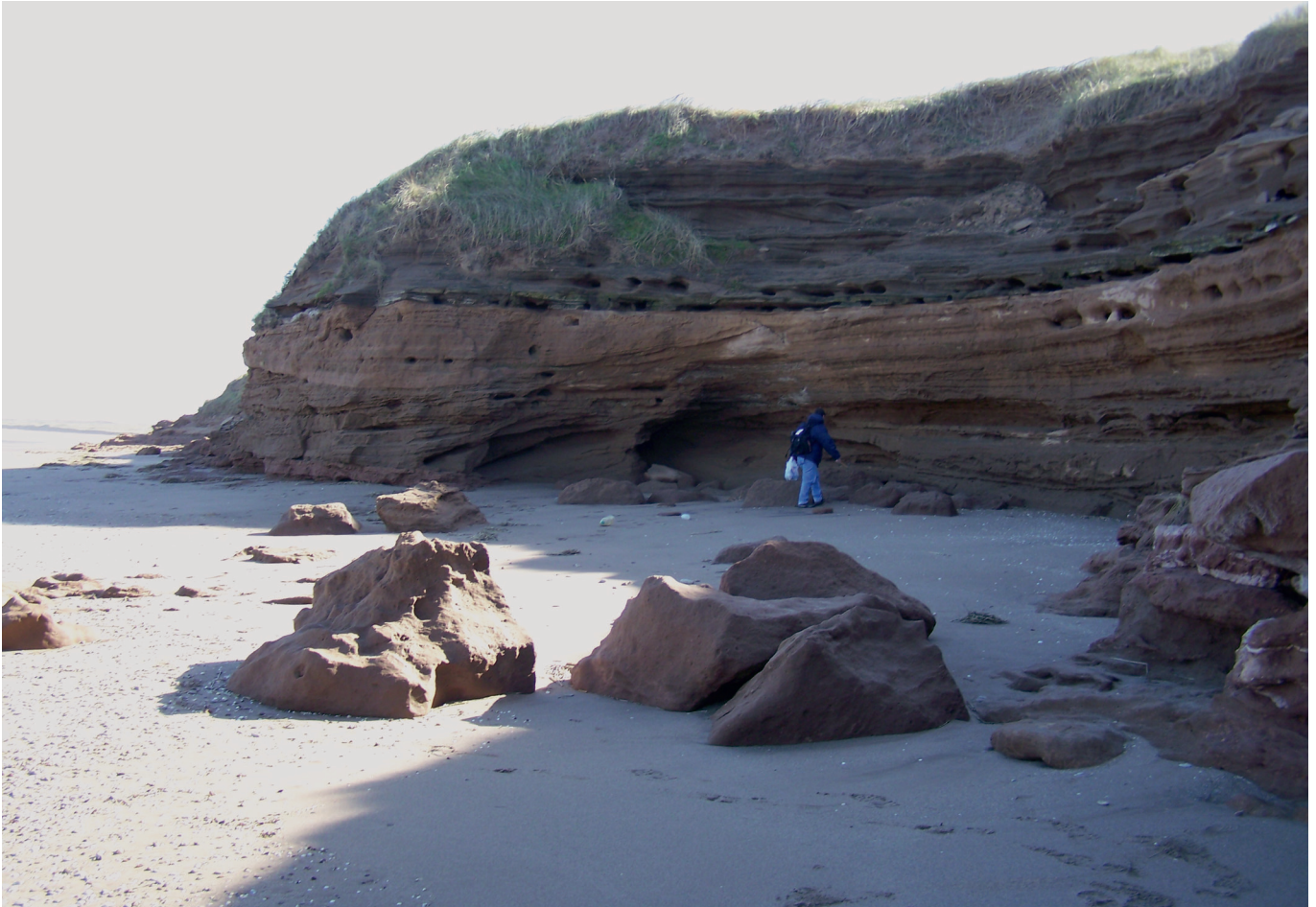
Figura 3. Barranca de Monte Hermoso. Monte Hermoso cliff.