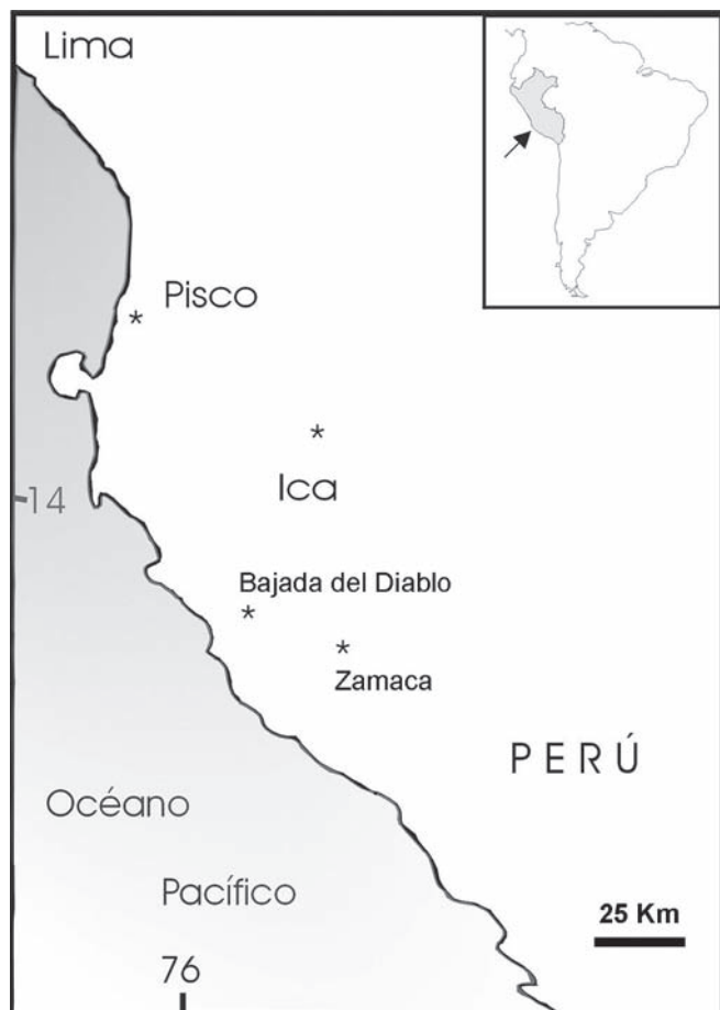
Figura 2. Mapa de ubicación. Location map.

Palaeodyptinae, Paraptenodytinae y Spheniscinae, mientras que la fuerte fusión de los metatarsales lo distingue de los Spheniscinae. Consecuentemente, la combinación de los siguientes caracteres permite asignarlo a la Subfamilia Palaeospheniscinae: forma alargada con un índice de elongación (longitud máxima/ ancho proximal) mayor que 2, sulcus longitudinalis dorsalis lateralis y medialis menos profundos que en Spheniscus , especialmente el medialis que no se prolonga más allá de la mitad de la facies cranialis , incisuras intertrochlearis medialis y lateralis alcanzando el mismo nivel que en Spheniscus , mientras que en Palaeospheniscus , esta última se prolonga hasta un nivel más proximal, foramen vasculare proximale bien desarrollado y foramen vasculare proximale mediale muy reducido y no abierto sobre la facies caudalis , fossa infracotylaris dorsalis medialis triangular, crista lateralis hypotarsi menos desarrollada que la crista medialis hypotarsi .