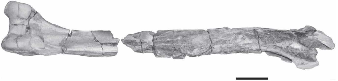
Figura 3. MUSM 224, Spheniscidae indet. tibiotarso izquierdo. MUSM 224, Spheniscidae indet. left tibiotarsus.

tuberositas popliteus es ancha y se encuentra dividida en dos por un surco, la facies articularis medialis es menor que la lateralis , mientras que esta relación es inversa en S. humboldti Meyen, 1834. Sobre el condylus lateralis se presenta una fosa que no se observa en S. humboldti . También aparece una ligera depresión sobre el epicondylus medialis . La distancia anteroposterior a nivel distal es ligeramente mayor que el ancho latero-medial. El sulcus intercnemialis se extiende hasta el extremo proximal conservando la misma profundidad en todo su recorrido como en Parapternodites antarctica . El pons supratendinosus es ancho y su superficie presenta una relación ligeramente oblicua respecto a la facies cranialis . Sobre el lateral externo de este puente, se presenta un tubérculo proporcionalmente más robusto que en Spheniscus . El canalis extensorius posee sección oval. Sobre el reborde interno del sulcus extensorius se presenta un tubérculo poco marcado. La fossa flexoria es más superficial que en Spheniscus . El epicondylus medialis se proyecta formando una única prominencia redondeada.