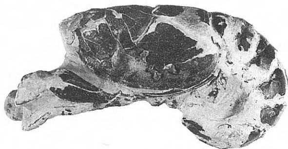
Figura 3. Ejemplar figurado de Hoploparia sp. número MNCNI-3789, que se conserva en el Museo Nacional de Ciencias Naturales de Madrid.

Real el artículo, quizás atraído por su belleza y su buena preservación, y conocedor de que en ese momento era un ejemplar único en las colecciones privadas europeas.